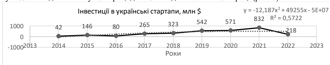
Рис. 6. Динаміка інвестування в українські стартапи за період 2014-2022 рр. Джерело: фонд AVentures Capital [12]

Погіршення ділового середовища призвело до зменшення обсягів інвестування в українські стартапи. Хоча це було очікуване падіння, але з початком війни у 2022 році значна кількість інвесторів заморозили угоди. Відбулося різке зменшення обсягів інвестування з рекордного обсягу в 832 млн дол. США у 2021 році до 218 млн дол. США в 2022 році (рис. 6).