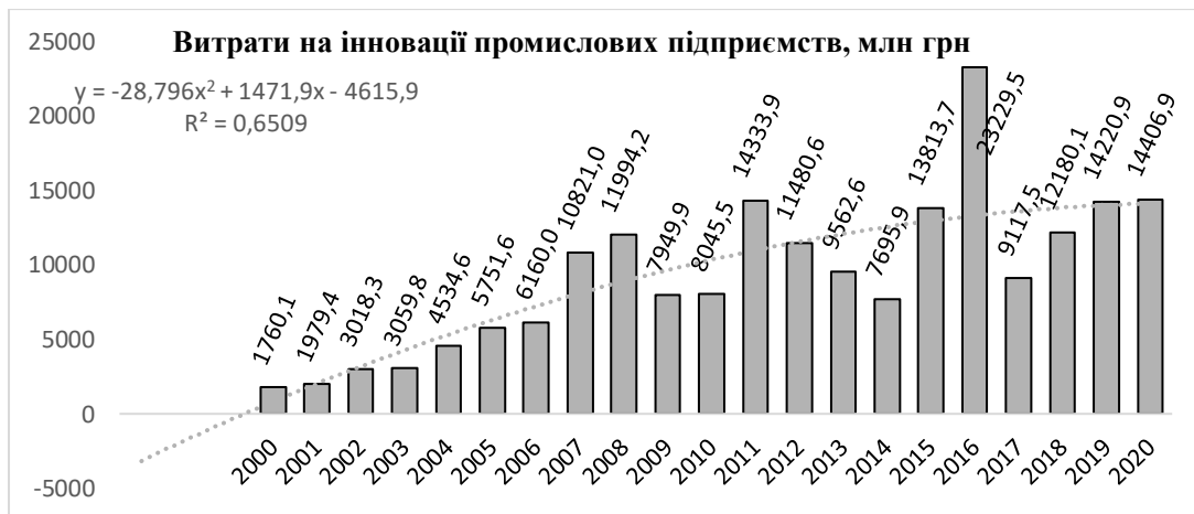
Рис. 4. Динаміка витрат промислових підприємств на інновації за період 2000-2020рр. Джерело: Державна служба статистики України [1]

В сучасному світі запроваджено різні методики оцінювання активності та сприятливості ведення бізнес-процесів. Всесвітній банк здійснює оцінку ведення бізнесу серед 190 країн світу. Індекс легкості ведення бізнесу (Doing Business Index) складається з 10 субіндексів. Останній звіт «Doing Business 2020», представлений Світовим банком, висвітлює результати досліджень щодо свободи ведення бізнесу [13]. Рейтинг України серед інших країн світу за індексом Doing Business представлено на рис. 5.