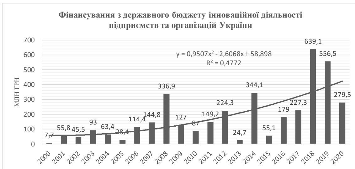
Рис. 2. Фінансова підтримка діяльності підприємств та організацій з державного бюджету

Проаналізуємо інноваційну активність вітчизняних підприємств (рис. 3).