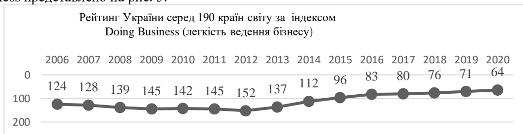
Рис. 5. Рейтинг України серед 190 країн світу за Doing Business Index

В сучасному світі запроваджено різні методики оцінювання активності та сприятливості ведення бізнес-процесів. Всесвітній банк здійснює оцінку ведення бізнесу серед 190 країн світу. Індекс легкості ведення бізнесу (Doing Business Index) складається з 10 субіндексів. Останній звіт «Doing Business 2020», представлений Світовим банком, висвітлює результати досліджень щодо свободи ведення бізнесу [13]. Рейтинг України серед інших країн світу за індексом Doing Business представлено на рис. 5.