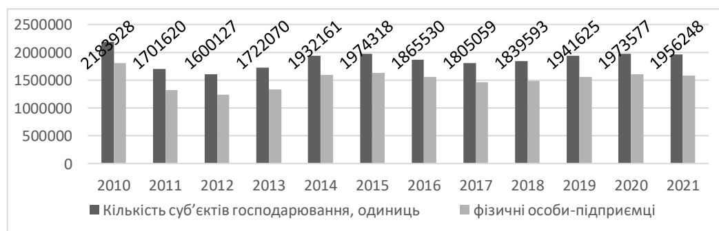
Рис. 1. Порівняльна характеристика загальної кількості суб'єктів підприємницької діяльності і зареєстрованих фізичних осіб-підприємців за період 2010-2021рр.

Як свідчать дані табл. 1, за період 2010 – 2021 рр. в Україні відбулося зменшення кількості суб'єктів господарювання на 227680 од., що становить 10,4%. Протягом аналізованого періоду спостерігаються тенденції до спаду активності бізнес-структур (в 2012р., 2017р. та 2021р.), на що вплинули всесвітня фінансово-економічна криза, політичні події в країні, пандемія тощо. Активізація підприємницької діяльності спостерігається в 2015р. та 2020р., де відбулось збільшення кількості підприємницьких структур, що є позитивною тенденцією (рис. 1).