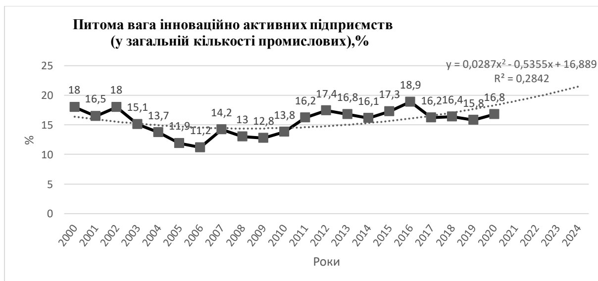
Рис. 3. Інноваційна активність вітчизняних підприємств (питома вага в загальній кількості промислових підприємств)

Проаналізуємо інноваційну активність вітчизняних підприємств (рис. 3).