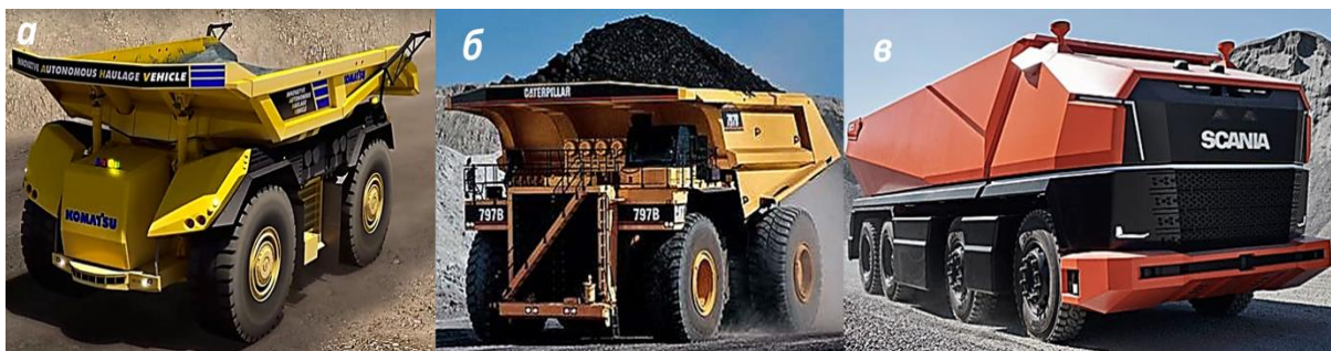
Рис. 3. Автонгомні безпілотні роботизовані автосамоскиди: а – «Komatsu», б – «Caterpillar», в – «Scania»

До світових лідерів у виробництві АБРА, окрім компанії «Komatsu» (Японія), слід віднести «Caterpillar» (США), «БелАЗ» (Білорусь), «Scania» та «Volvo» (Швеція), «Hitachi» (Південна Корея), а також «Liebherr» (ФРН) [4-10].